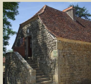
Le bâtiment de l'Association à Salgues Salle « Michel Doumerc »

Bulletin n°1 / 2014 Janvier - Février - Mars