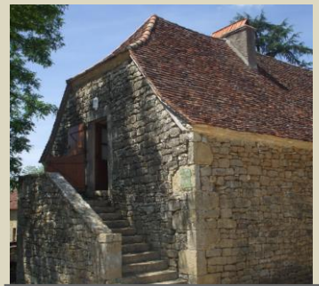
Le bâtiment de l'Association à Salgues Salle « Michel Doumerc »