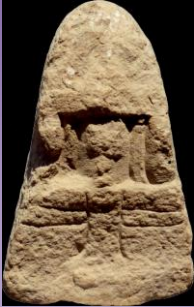
Statuette du Puy d'Issolud