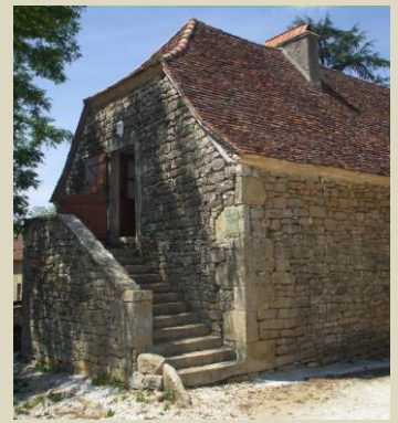
Le bâtiment de l'Association à Salgues Salle « Michel Doumerc »