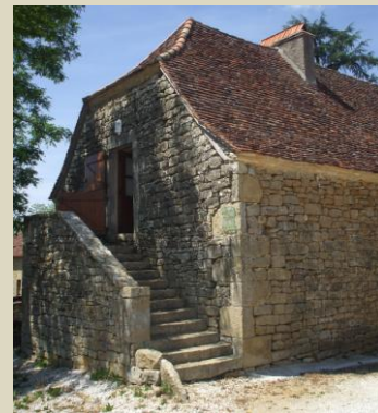
Le bâtiment de l'Association à Salgues Salle « Michel Doumerc »

Bulletin n° 4 / 2012 Octobre - Novembre - Décembre