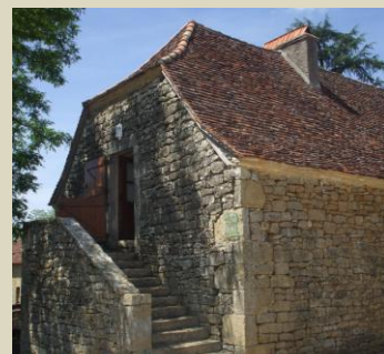
Le bâtiment de l'Association à Salgues Salle « Michel Doumerc »