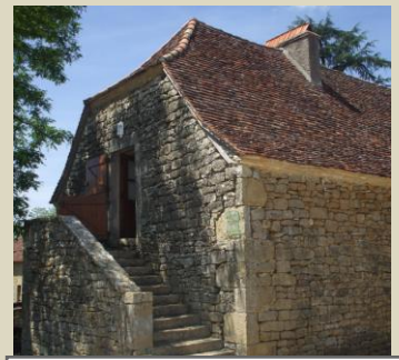
Le bâtiment de l'Association à Salgues Salle « Michel Doumerc »